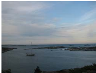
För ankar vid V Ravane