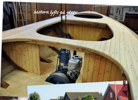
Motorn lyfts på plats.