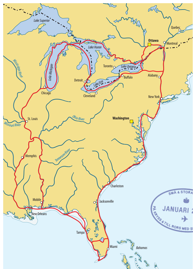
ILLUSTRATION: JONAS ARVIDSSON

Efter 35 slussar och 15 lyftbroar kom vi efter tolv