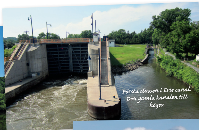
Första slussen i Erie canal. Den gamla kanalen till höger.