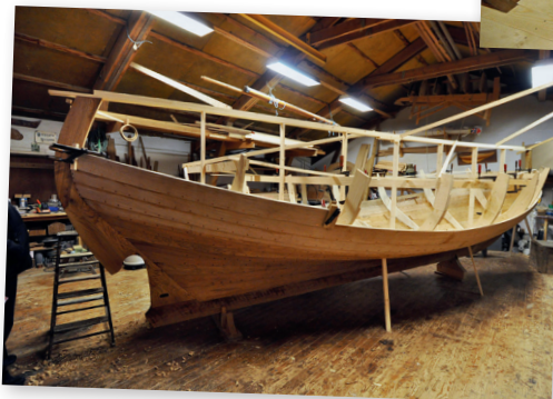
Hälften av bordläggningen är klar.