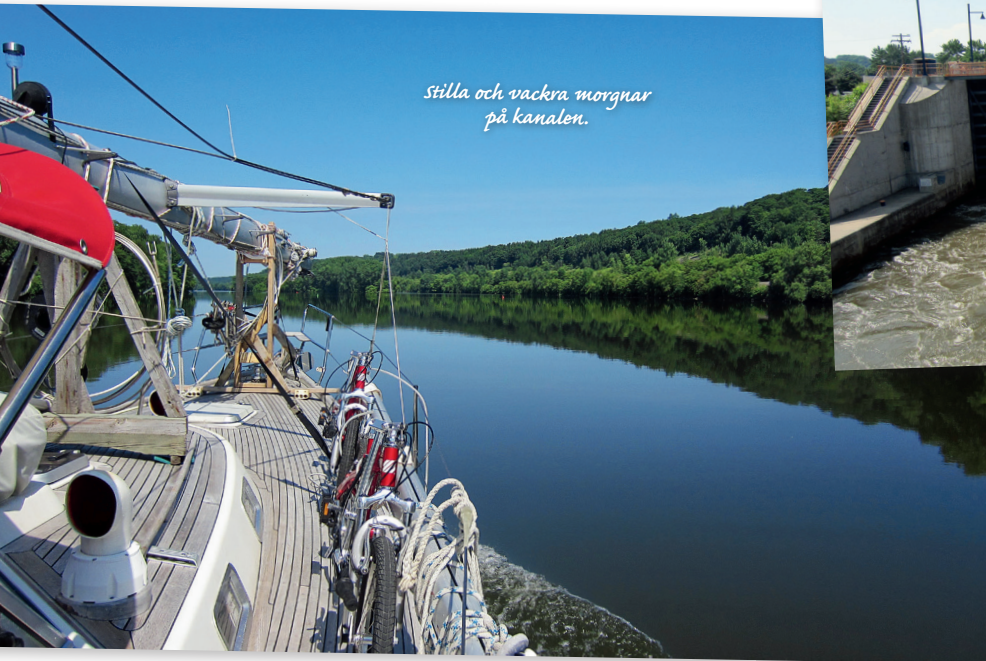
Stilla och vackra morgnar på kanalen.