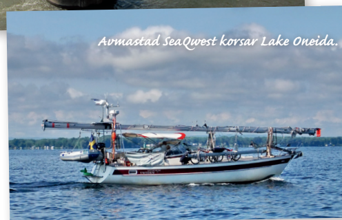
Arvmaslad SeaQwest korsar Lake Oneida.